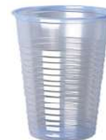
REF. 1025 - FLO BICCHIERE 20 L ACQUAPROJECT TRASLUCIDO

CARTONE: 1.500 pezzi FILE: 30 da 50 pezzi GRAMMATURA: 2,5 gr