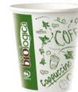
REF. 1080 - FLO BICCHIERE 14-16 CL 50Z

CARTONE: 2.400 pezzi FILE: 30 da 80 pezzi GRAMMATURA: 4,6 gr