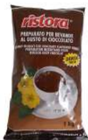
REF. 4019 - RISTORA CIOCCOLATO DENSO