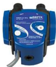
BI297174 - BRITA PURITY C HEAD 30% JG