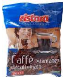
REF. 3103 - RISTORA CAFFÈ LIOF DECAFFEINATO