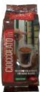
REF. 4001 - RISTORA CIOCCOLATO DABB