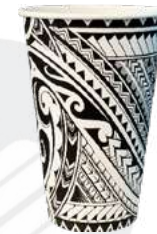
REF. 1225 - FLO BICCHIERE 34 CL 120Z

CARTONE: 1.000 pezzi FILE: 20 da 50 pezzi GRAMMATURA: 8,7 gr