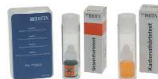
BI710800 - BRITA KIT TEST DUREZZA