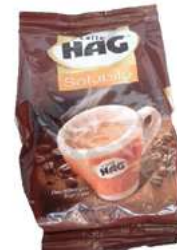
REF. 3121 - HAG CAFFÈ LIOFILIZZATO