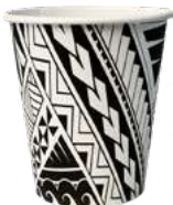
REF. 1213 - FLO BICCHIERE 15 CL 60Z

CARTONE: 2.400 pezzi FILE: 30 da 80 pezzi GRAMMATURA: 4,4 gr - 4,6 gr