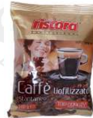
REF. 3101 - RISTORA CAFFÈ Istantaneo LIOF