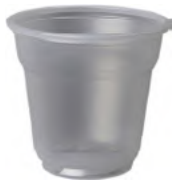
REF. 1043 - FLO BICCHIERE 88 L TRASLUCIDO MANUALE

CARTONE: 4.200 pezzi FILE: 84 da 50 pezzi GRAMMATURA: 1,85 gr