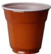
REF. 1054 - FLO BICCHIERE 88 L BICOLORE MANUALE

CARTONE: 4.200 pezzi FILE: 84 da 50 pezzi GRAMMATURA: 1,85 gr