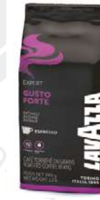
REF. 3154 - LAVAZZA GUSTO FORTE