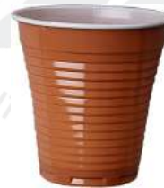
REF. 1024 - FLO BICCHIERE 165 TM BICOLORE MANUALE

CARTONE: 3.000 pezzi FILE: 50 da 50 pezzi GRAMMATURA: 2,5 gr