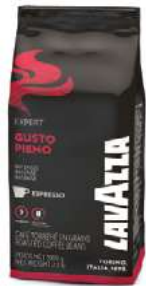
REF. 3062 - LAVAZZA GUSTO PIENO