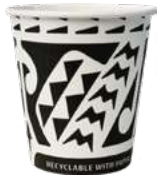
REF. 1156 - FLO BICCHIERE 8 CL 30Z

CARTONE: 1.250 pezzi FILE: 25 da 50 pezzi GRAMMATURA: 2,36 gr