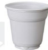
REF. 1042 - FLO BICCHIERE 88 L BIANCO MANUALE

CARTONE: 4.200 pezzi FILE: 84 da 50 pezzi GRAMMATURA: 1,85 gr