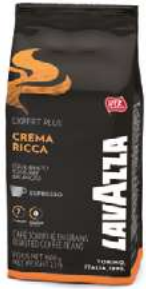
REF. 3003L - LAVAZZA CREMA RICCA