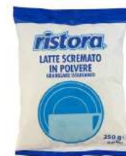
REF. 6020 - RISTORA LATTE SCREMATO IN POLVERE