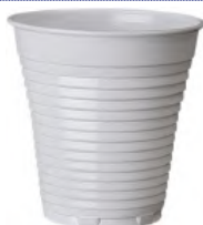
REF. 1007 - FLO BICCHIERE 165 TM BIANCO MANUALE

CARTONE: 3.000 pezzi FILE: 50 da 50 pezzi GRAMMATURA: 2,5 gr