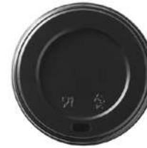
REF. 1220 - FLO COPERCHIO 120Z 80 MM

CARTONE: 1.000 pezzi FILE: 10 da 100 pezzi GRAMMATURA: 2,15 gr