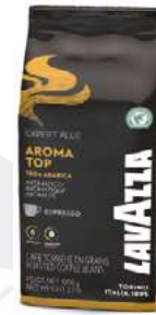
REF. 2962 - LAVAZZA AROMA TOP