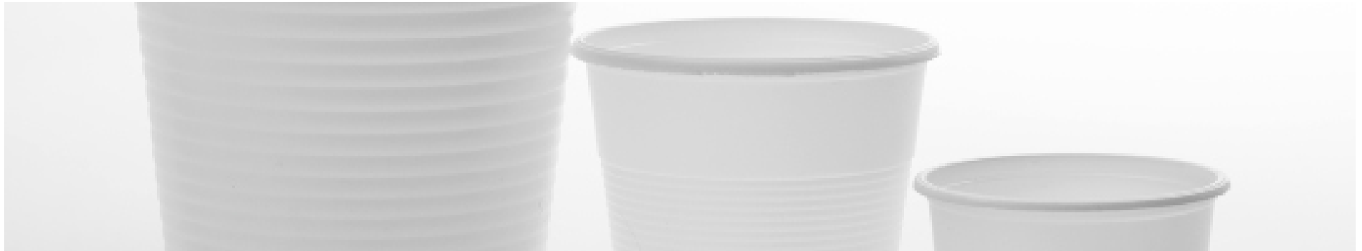
REF. 1097 - FLO BICCHIERE 100 DA TRANSLUCIDO