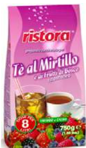
REF. 5020 - RISTORA TÈ MIRTILLO