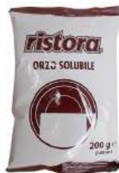
REF. 9013 - RISTORA ORZO SOLUBILE