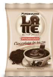
REF. 4007 - PERUGINA CIOCCOLATA AL LATTE