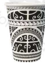
REF. 1263 - FLO BICCHIERE 18 CL 70Z

CARTONE: 2.400 pezzi FILE: 80 da 30 pezzi GRAMMATURA: 4,4 gr - 4,77 gr