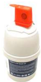
BI1002008 - BRITA PURITY C25

La loro funzione d'uso consiste nella prevenzione di depositi di calcare tramite la riduzione della durezza dell'acqua, nella ritenzione di sostanze chimiche ed organiche responsabili di alterazioni sgradevoli del gusto e nella rimozione di particelle estranee dall'acqua.