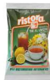
REF. 5002 - RISTORA TÈ AL LIMONE