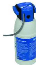
BI102831 - BRITA PURITY C50