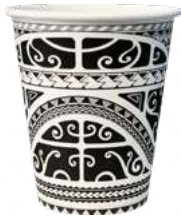
REF. 1264 - FLO BICCHIERE 25-28 CL 8.90Z

CARTONE: 1.680 pezzi FILE: 28 da 60 pezzi GRAMMATURA: 7,22 gr