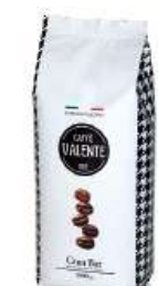
REF. 3023 - CAFFÈ VALENTE 1913 GRAN BAR