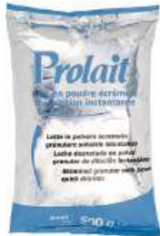
REF. 6019 - PROLAIT LATTE SCREMATO GRANULARE