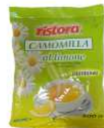
REF. 9002 - RISTORA CAMOMILLA AL LIMONE